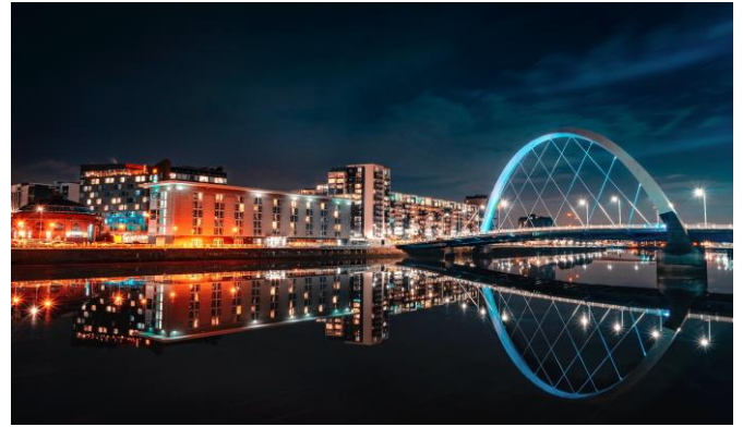
Fraunhofer CAP in Glasgow.

Die britische Regierung hat ein klares Ziel für das Vereinigte Königreich als globale Wissenschaftssupermacht und Innovationsnation gesetzt, sodass sie Wissenschaft und Technologie in den Mittelpunkt gestellt und die Photonik als eine der Schlüsselindustrien anerkannt hat, die zukünftiges Wachstum vorantreiben kann. Das britische Ökosystem ist in verschiedene hochspezialisierte Cluster unterteilt, von denen jeder bestimmte Segmente der Branche bedient: Die Region Torbay ist einer der wichtigsten Standorte in Großbritannien für fortgeschrittene Elektronik, insbesondere Photonik, wo viele spezialisierte High-Tech-Fertigungsunternehmen ihren Sitz haben. Bekannt ist die Region u.a. für Microelectromechanical systems (MEMS) und Photonics Packaging (PIC). In Glasgow ist die Fraunhofer-Gesellschaft ansässig, die über ein weltweites Netzwerk erfolgreicher Forschungs- und Technologiezentren verfügt.